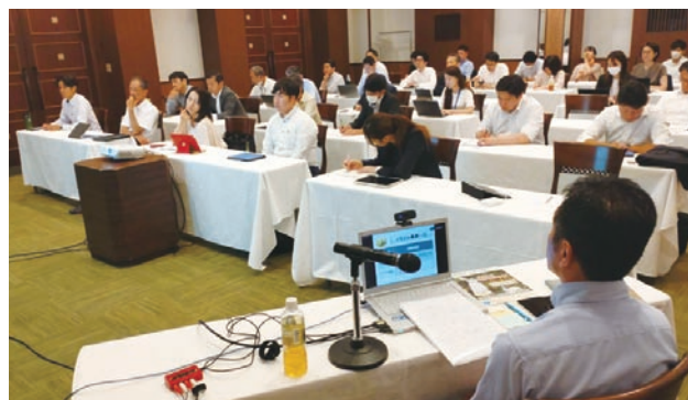
久留米会場【ホテルニュープラザ久留米】