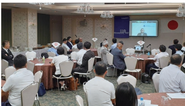
北九州会場【小倉リーセントホテル】