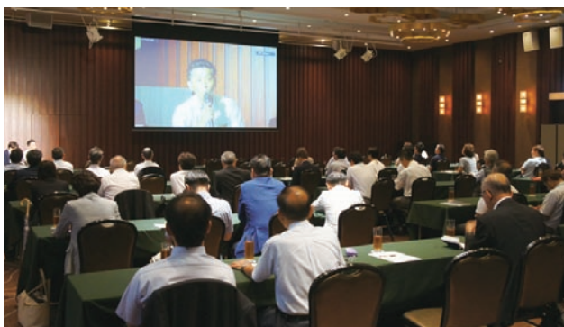
福岡会場【八仙閣 本店】